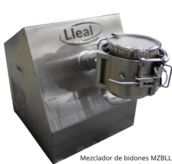
Mezclador de bidones MZBLL-315 con abrazadera preparada para trabajar con dos bidones de diferente diámetro.

El modelo MZBLL (para bidones) dispone de una abrazadera adaptada al diámetro del bidón, pudiendo trabajar en un rango de 20 a 700 L. Estos equipos permiten la incorporación de un adaptador que permite trabajar con bidones de diferente capacidad.