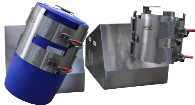
Mezclador MZBLL-550 preparado para trabajar con bidones de plástico. Dispone de doble abrazadera de diseño especial con cierres y tope de seguridad.