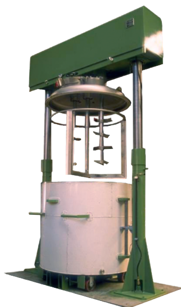
Dissolver Tríplex de accionamiento mecánico

El Dissolver DÚPLEX es un equipo que combina la función de dispersión con un disco cowles de alta velocidad y de mezcla con palas de velocidad lenta. Así se favorece la eficacia del proceso ya que las palas fuerzan el paso del producto a través del disco cowles , evitando la formación del vórtice y por tanto consiguiendo un mayor grado de mezcla.