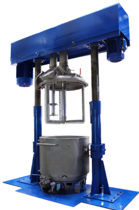
Dissolver Dúplex S-2 50-20/VF. Equipo preparado para trabajar al vacío con depósito para descargar con prensa hidráulica